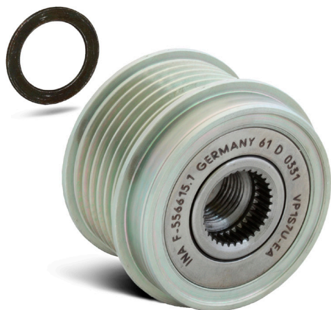
Billede 2: Ved montering af friløbshjulet til en Bosch generator skal man bruge den vedlagte 1,4 mm afstandsskive!

Som følge af kraftige dynamiske bevægelser af kileremmen kan der i køretøjer med en fast generatorremskive dannes høj støj.