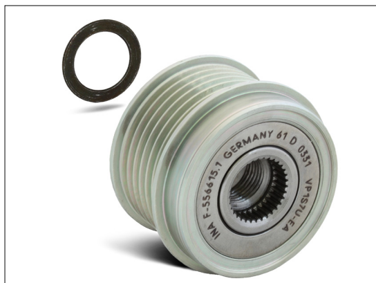
Slika 2: Kod montaže remenice slobodnog hoda na alternator Bosch mora se koristiti priloženi držač razmaka debljine 1,4 mm!

Zbog jakih dinamičkih pokreta klinastog remena kod vozila s fiksnom remenicom alternatora može dolaziti do stvaranja glasne buke.