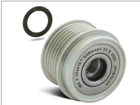
Fig. 2: Bij de montage van de dynamovrijloop bij een Bosch-dynamo moet de bijgevoegde afstandsring met een dikte van 1,4 mm worden gebruikt!

Sterke, dynamische bewegingen van de multiriem kunnen bij voertuigen met starre dynamorol veel lawaai produceren.