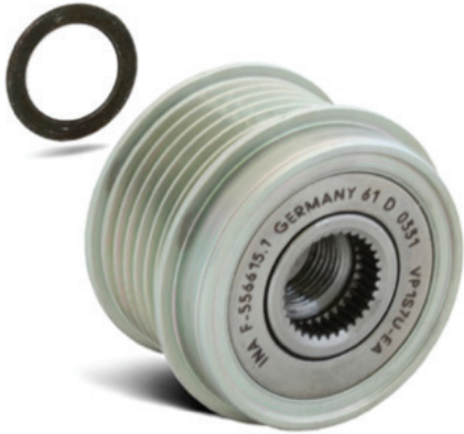
Resim 2: Devir ayarlı alternatör kasnağını bir Bosch alternatöre monte ederken, 1,4 mm kalınlığında kapalı bir şim kullanılmalıdır!

V kayışın güçlü, dinamik hareketleri nedeniyle, rijit alternatör kayış kasnağına sahip araçlarda yüksek sesler üretilebilir.