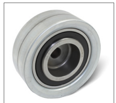
Figura 2: Nuova versione in lamiera

Nell'ambito del continuo processo di sviluppo e miglioramento dei nostri prodotti, la superficie di scorrimento del rullo di rinvio 532 0111 10 è stata modificata da metallo sinterizzato a lamiera.