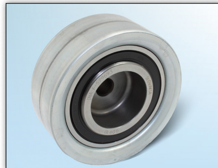
Obrázok 2: Nové vyhotovenie z plechu

V rámci neustáleho vývoja našich produktov bola zmenená obežná plocha vodiacej kladky 532 0111 10 zo spekaného kovu na plech.