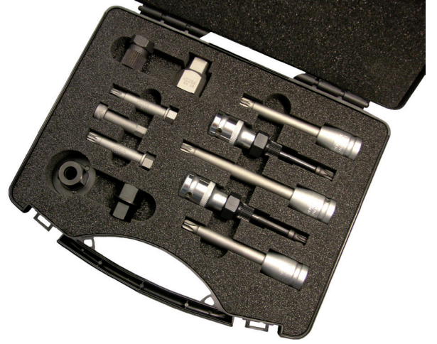
Şekil 3 : INA özel servis takımı Parça No. 400 0241 10

Şekil 2'de devir ayarlı çalışma alternatör kasnağı 535 0229 10 satışa hazır modeli (sağ) ve üretim modeli (sol) gösterilmektedir.