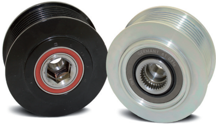
Şekil 1 : Devir ayarlı alternatör kasnağı 535 0214 10