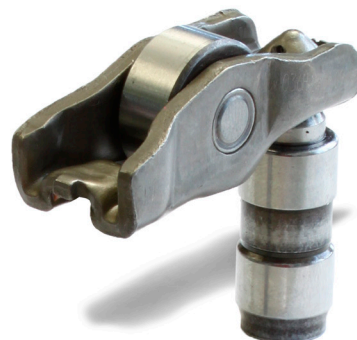
Billede 2: Version 2

Ved udskiftning af vippearmsen 422 0053 10 kan begge de viste versioner i figur 1 og figur 2 monteres i køretøjet.