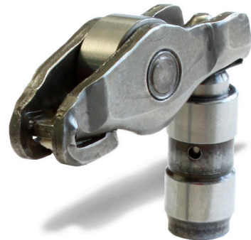
Εικόνα 1: Έκδοση 1

Κωδικός OE: 036 109 411 E 036 1 09 411 G 036 109 411 H 036 109 411 J