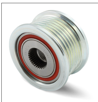
Slika 1: Stara (prethodna) izvedba

Model: Toyota Hilux, Fortuner Motor: 2.5 D-4D, 3.0 D4-D Kat. Br.: 535 0128 10 OE broj: 27415-0L040