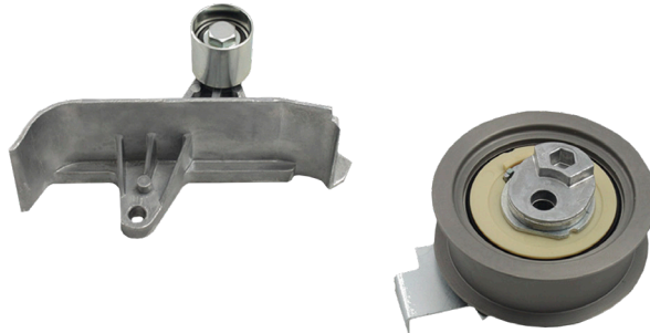
Снимка 2: KIT 530 0546 10 (ляво), Set 530 0546 09 (дясно)

В автомобилите изброени горе, вибрационния демпфер 533 0028 20 (Снимка 1, ляво) и обтегач 531 0531 20 (Снимка 1, дясно) са заменени с KIT 530 0546 10 (Снимка 2, ляво) и Set 530 0546 09 (Снимка 2, дясно)