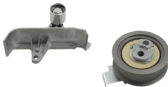
Obrázek 2: Aktuální provedení, vlevo vodící kladka s držákem 532 0601 10, vpravo napínací kladka 531 0840 10

U výše uvedených vozidel byly tlumič vibrací 533 0028 20 (obrázek 1, vlevo) a napínací kladka 531 0531 20 (obrázek 1, vpravo) nahrazeny vodící kladkou s držákem 532 0601 10 (obrázek 2, vlevo) a napínací kladkou 531 0840 10 (obrázek 2, vpravo).