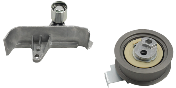
Kuva 2: Nykyinen malli, vasemmalla pidikkeellä varustettu ohjairulla 532 0601 10, oikealla kiristin 531 0840 10

Edellä esitetyissä ajoneuvoissa on värähtelynvaimennin 533 0028 10 (kuva 1, vasemmalla) ja hihnankiristin 531 0531 20 (kuva 1, oikealla) korvattu pidikkeellä varustetulla ohjainrullalla (kuva 2, ohjainrulla pidikkeellä 532 0601 10 ja kiristin 531 0840 10). Huomaa tuotenumerojen muutokset!