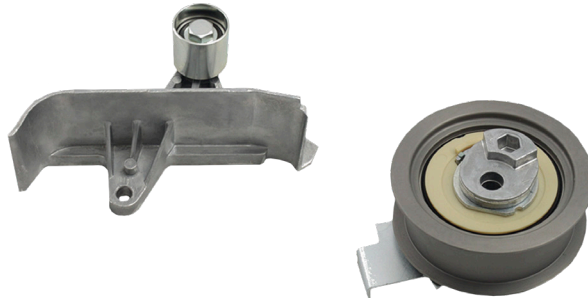
2. ábra: Balra az 532 0601 10 cikkszámú terelőgörgő a tartóval, jobbra az 531 0840 10 cikkszámú feszítőgörgő

A fent megnevezett járműveknél az 533 0028 20 cikkszámú rezgéscsillapítót (1. ábra, balra) és az 531 0531 20 cikkszámú feszítőgörgőt (1. ábra, jobbra) az 532 0601 10 cikkszámú vezetőgörgő a tartóval (2. ábra, balra) és az 531 0840 10 cikkszámú feszítőgörgő (2. ábra, jobbra) helyettesíti.