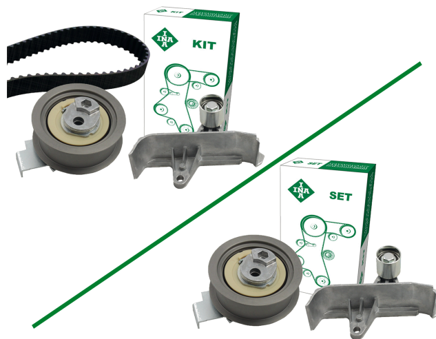
Figur 2: SETT 530 0546 10 (venstre), Pakke 530 0546 09 (høyre)

Bruken av en blanding komponenter er ikke tillatt, ettersom komponentene er tilpasset hverandre, og sikrer bare riktig remspenning når de brukes sammen.