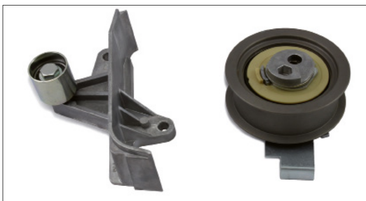
Obrázok 2: Aktuálne vyhotovenie, vľavo vodiaca kladka s držiakom 532 0601 10, vpravo napínacia kladka 531 0840 10

V prípade starého vyhotovenia zaisťuje tlmič vibrácií prostredníctvom napínacej kladky aj napnutie remeňa. Nová vodiaca kladka s držiakom 532 0601 10 má iba funkciu vedenia remeňa. Napnutie remeňa a vibrácií je zaistené výhradne prostredníctvom napínacej kladky 531 0840 10.