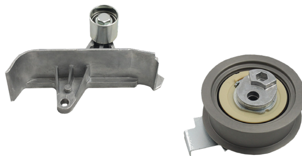
Bild 2: Det aktuella utförandet, till vänster avlänkingsrulle med hållare 532 0601 10, till höger spännrulle 531 0840 10

Hos ovannämnda fordon har vibrationsdämpare 533 0028 20 (bild 1, till vänster) och spännrulle 531 0531 20 (bild 1, till höger) ersatts av avlänkingsrulle med hållare 532 0601 10 (bild 2, till vänster) och spännrulle 531 0840 10 (bild 2 till höger).