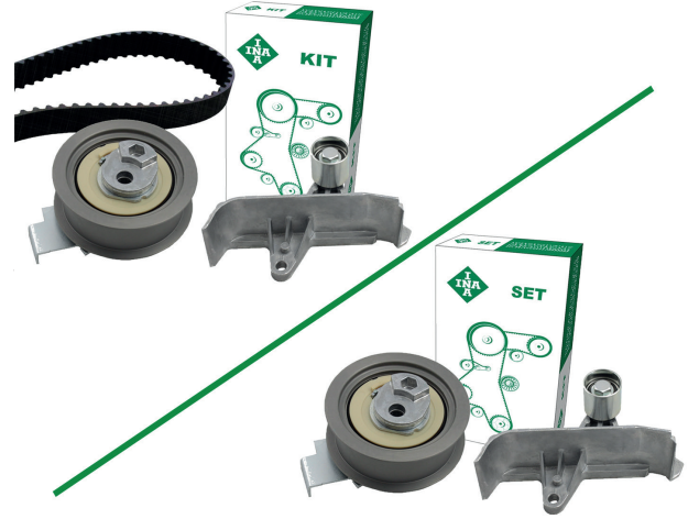
Şekil 2: KIT 530 0546 10 (sol), Set 530 0546 09 (sağ)

İlgili parça referanslarını, www.schaeffler.com.tr veya www.rexpert.com.tr adreslerindeki online kataloglarımızdan bulabilirsiniz.