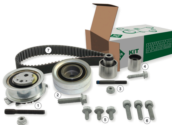
Снимка 1: Комплект обтяжма ролка INA 530 0550 10

Всички компоненти в обтяжния блок са разработени да постигат еднакъв сервизен живот и са обект на еднакво износване.