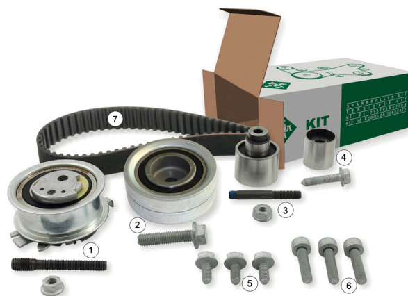
Obrázek 1: INA KIT napínací kladky 530 0550 10

Všechny komponenty napínací jednotky jsou konstrukčně dimenzovány na stejnou životnost a podléhají společnému opotřebení.