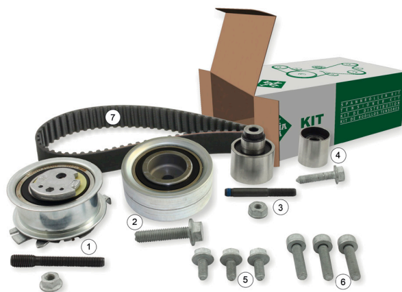
Εικόνα 1: Τροχαλία τάνσης INA Kit 530 0550 10

*Set = δεν περιλαμβάνεται ο ιμάντας χρονισμού