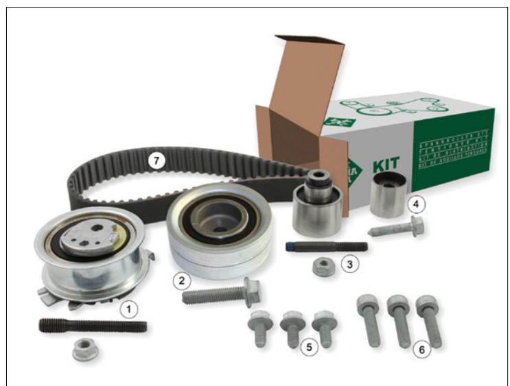
Foto1: Zestaw rolek z paskiem rozrządu – 530 0550 10

Schaeffler Automotive Aftermarket zaleca wymianę wszystkich elementów podczas naprawy napędu rozrządu.