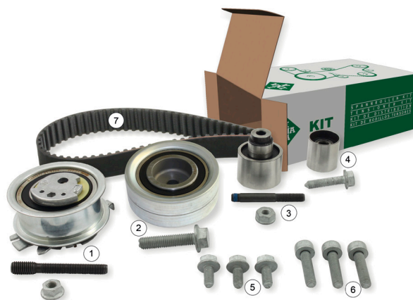
Рисунок 1: Ремонтный комплект натяжных роликов INA KIT 530 0550 10

Все компоненты ременного привода ГРМ разрабатываются таким образом, чтобы достичь одинакового ресурса и подвергаться одинаковому износу.