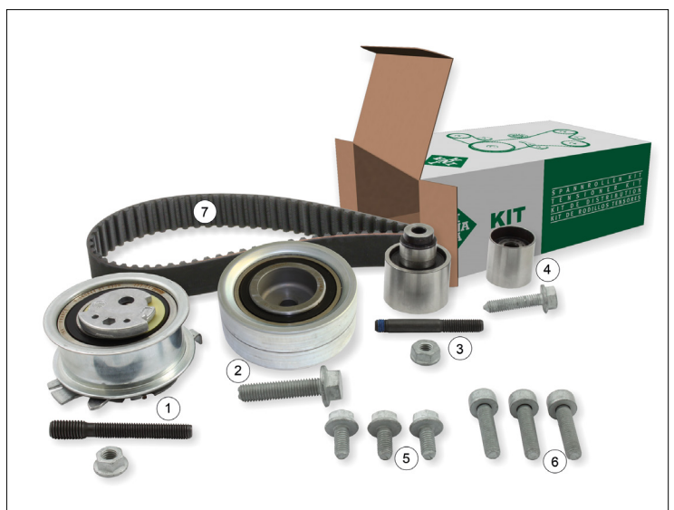
Obrázok 1: INA KIT napínacie kladky 530 0550 10

Všetky komponenty napínacie jednotky sú konštrukčne dimenzované na rovnakú životnosť a podliehajú spoločnému opotrebeniu.