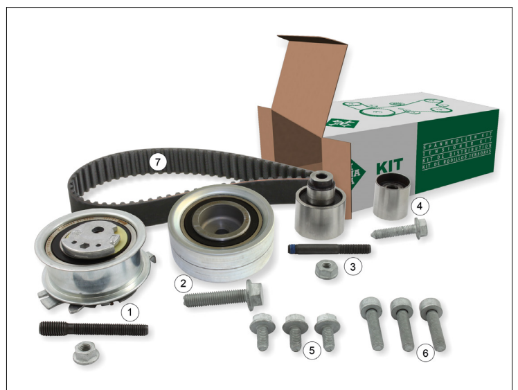
Slika 1: INA napenjalni valj kit 530 0550 10

*Garnitura = jermen za pogon in krmiljenje odmikalne gredi ni priložen