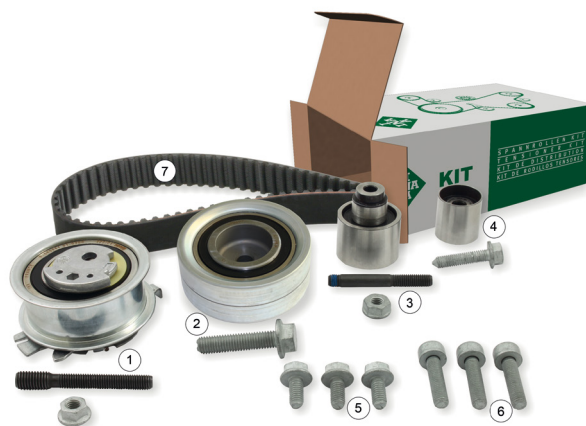
Bild 1: INA KIT spännrullar 530 0550 10

Samtliga komponenter hos remspännarenheten har dimensionerats till samma livslängd konstruktionsmässigt och de utsätts för gemensamt slitage.