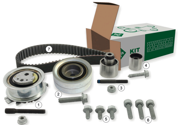
Зображення 1: Ремонтний комплект INA 530 0550 10

Номери оригінального обладнання: 03L 198 119 A 03L 198 119 B 03L 198 119 C 03L 198 119 D