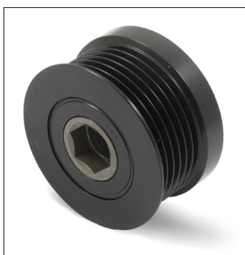
Slika 1: Stara izvedba