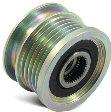
Снимка 2: Механизъм за свободен ход на генератор 535 0143 10

Като техническо решение Schaeffler Automotive Aftermarket за тези превозни средства предлага механизъм за свободен ход на генератор. Това намалява динамичното натоварване на задвижването на спомагателните възли и по този начин предотвратява шума.