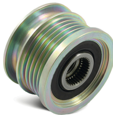
Obrázek 2: Alternátorová volnoběžka 535 0143 10

Jako technické řešení nabízí Schaeffler Automotive Aftermarket pro tato vozidla alternátorovou volnoběžku. Ta snižuje dynamické zatěžování pohonu přídatných agregátů a zamezuje tak vzniku hluku.