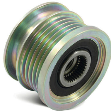
Εικόνα 2: Τροχαλία δυναμό με κασάνια 535 0143 10

Σαν τεχνική λύση, η Schaeffler Automotive Aftermarket προσφέρει μια τροχαλία δυναμό με κασάνια OAP για αυτά τα αυτοκίνητα. Αυτό μειώνει τα δυναμικά φορτία στον ιμάντα αξεσουάρ, και αποτρέποντας έτσι το θόρυβο.