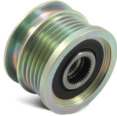
Kuva 2: Laturin vapaapyörä 535 0143 10

Teknisenä ratkaisuna on Schaeffler Automotive Aftermarketin tarjonnassa näihin autoihin sopiva laturin vapaapyörä. Se vähentää apulaitekäytön dynaamista kuormitusta ja rajoittaa siten melun syntyä.