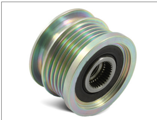
Photo 2 : Poulie à roue libre d'alternateur 535 0143 10

Pour remédier à ce problème technique, Schaeffler Automotive Aftermarket propose une poulie à roue libre d'alternateur pour ces véhicules : en permettant de diminuer les charges dynamiques au sein du système d'entraînement des accessoires périphériques, cette poulie empêche la formation de bruits.