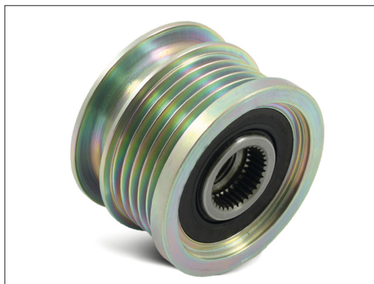
Slika 2: Remenica slobodnog hoda alternatora 535 0143 10

Kao tehničko rješenje, Schaeffler Automotive Aftermarket isporučuje remenicu slobodnog hoda alternatora za ova vozila. Ona smanjuje dinamičko opterećenje na pogon pomoćnih agregata i time sprječava širenje buke.