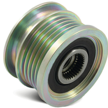
2. ábra: Generátor-szabardonfutó 535 0143 10

Műszaki megoldásként a Schaeffler Automotive Aftermarket ehhez a járműhöz egy generátor-szabardonfutót kínál. Ez csökkenti a segédhajtások dinamikus terheléseit és így megakadályozza a zajképződést.