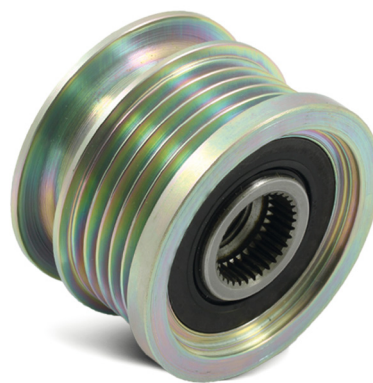
Figur 2: Friløpsremskive OAP 535 0143 10

Som en teknisk løsning tilbyr Schaeffler Automotive Aftermarket en friløpsremskive OAP til disse kjøretøyene. Dette reduserer de dynamiske belastningene i aggregatdriften, og hindrer dermed støyutslipp.