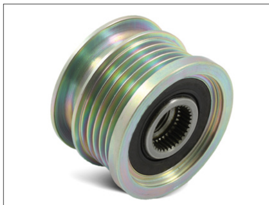
Foto1: Wymiana sztywnego koła pasowego na wolne koło pasowe alternatora.

Rozwiązaniem dla tych pojazdów jest oferowane przez Schaeffler Automotive Aftermarket wolne koło alternatora. Zmniejsza ono obciążenia w układzie osprzętu, przez co zabezpiecza przed emisją hałasu.