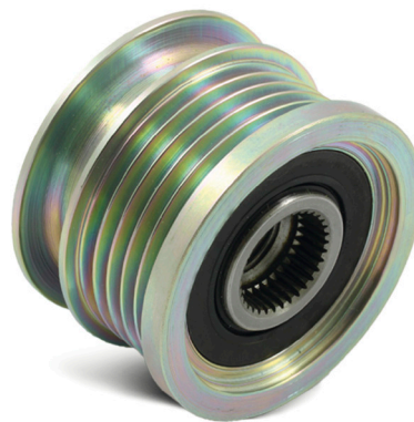
Figura 2: Folie de alternator cu sistem de rolă liberă 535 0143 10

Departamentul post-vânzare al Schaeffler Automotive recomandă montarea unei fulii de alternator cu sistem de rolă liberă 535 0143 10 la autovehiculele afectate. Atenție: Respectați întocmai instrucțiunile de montare incluse în pachet!