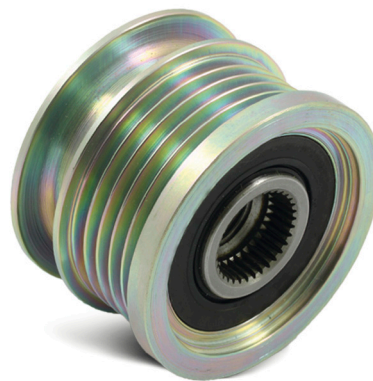
Рисунок 2: Шкив генератора с обгонной муфтой 535 0143 10

В качестве решения данной проблемы, Schaeffler Automotive Aftermarket предлагает шкив генератора с обгонной муфтой для этих автомобилей. Его применение значительно сокращает крутильные колебания в приводе вспомогательного оборудования, что, в свою очередь, снижает шумность узла.