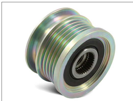
Obrázok 2: Alternátorová volnobežka 535 0143 10

Pozor: Bezpodmienečne je nutné dbať na priložené inštaláčnne pokyny!