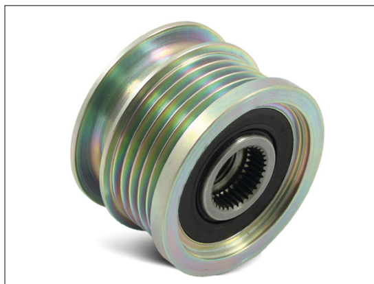
Slika 2: Prostotečna jermenica alternatorja 535 0143 10

Pri zgoraj navedenih vozilih z vgrajeno togo jermenico alternatorja lahko zaradi močnih vibracij rebrastega klinastega jermena nastaja glasen hrup.