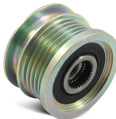
Bild 2: Frinavremskiva 535 0143 10

Som teknisk lösning marknadsför Schaeffler Automotive Aftermarket ett generatorfrinav till dessa fordon. Detta minskar den dynamiska belastningen i hjälppaggregatdriften och förhindrar på så sätt uppkomsten av buller.