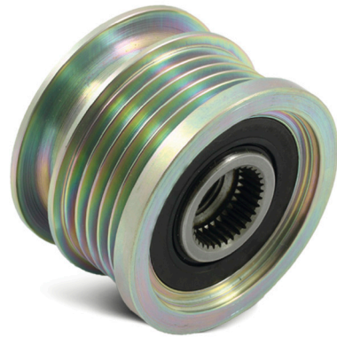
Зображення 2: Шків генератора з обгінною муфтою 535 0143 10

Компанія Schaeffler Automotive Aftermarket рекомендує виконати переобладнання автомобілів, у яких виникають такі шуми, замінивши жорсткий шків генератора на шків з обгінною муфтою 535 0143 10. Увага: обов'язково дотримуйтеся інструкції, що входить у комплект постачання!