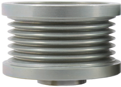
Resim 2: 6 kanallı 535020210 INA tek yönlü alternatör kasmağı

5 kanallı V kayışı 6 kanallı alternatör kasmağı üzerine yerleştirirken, dış kanalların boş bırakılması önemlidir (Resim 1, sol). Bu V kayışının dönerken hizalanmasını sağlar.