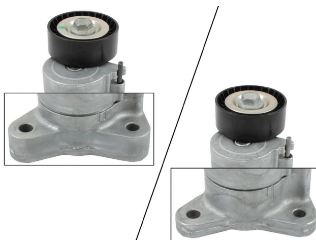
Снимка 3: Ляво, старата версия с широки точки на закрепване. Дясно, новата версия с по-тесни точки на закрепване.

Съблюдавайте спецификациите на производителя на автомобила!