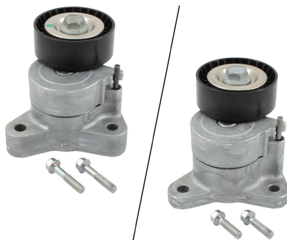
Снимка 1: Обтяжно рамо 534 0325 10 – ляво, стара версия с фиксиращи болтове. Дясно, нова версия с фиксиращи болтове.

Като част от непрекъснатите ни усилия да подобряваме нашите продукти, бяха направени промени в обтяжно рамо 534 0325 10.