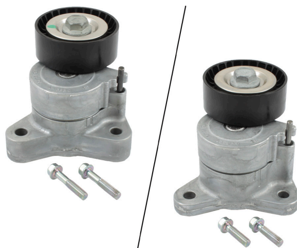
Obrázek 1: Napínací rameno 534 0325 10 – vlevo, staré provedení s upevňovacími šrouby. Vpravo, nové provedení s upevňovacími šrouby.

V rámci stálého dalšího vývoje našich produktů bylo modifikováno napínací rameno 534 0325 10.