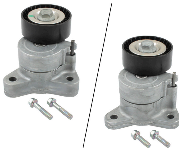
Billede 1: Strammearm 534 0325 10 – Venstre, gammel version med fastspændingsbolte. Højre, ny version med fastspændingsbolte

Som en del af vores fortløbende indsats for at forbedre vores produkter, er der blevet foretaget ændringer på strammearmen 534 0325 10.