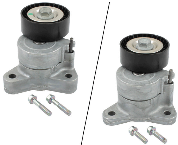
Εικόνα 1: Τεντωτήρας 534 0325 10 – αριστερά, παλιά έκδοση με βίδες στερέωσης. Δεξιά, νέα έκδοση με βίδες συγκράτησης.

Στα πλαίσια των συνεχών προσπαθειών μας για τη βελτίωση των προϊόντων μας, έχουν γίνει αλλαγές στο βραχίονα τάνυσης 534 0325 10.