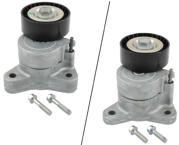
Kuva 1: Kiristinvarsi 534 0325 10 – vasemmalla, vanha malli kiinnitinruuveilla. Oikealla, uusi malli kiinnitysruuveilla

Tuotteidemme jatkuvan kehityksen puitteissa on kiristinvarteen 534 0325 10 tehty muutos.