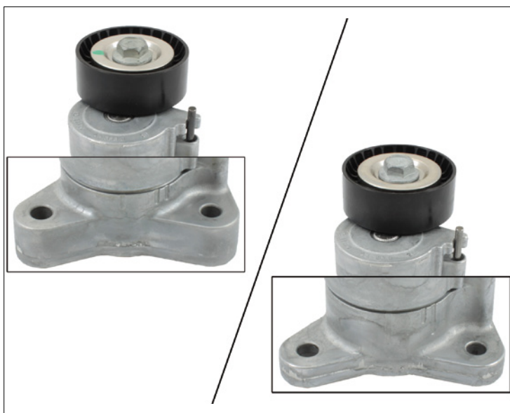
Fig 3: Links, oude uitvoering met brede bevestigingspunten. Rechts, nieuwe uitvoering met smalle bevestigingspunten.

Neem altijd de aanwijzingen van de autofabrikant in acht.