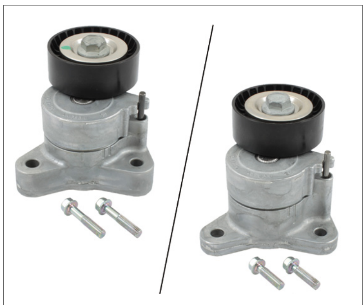
Fig. 1: Spanarm 534 0325 10 – Links, oude uitvoering met bevestigingsbouten. Rechts, nieuwe uitvoering met bevestigingsbouten.