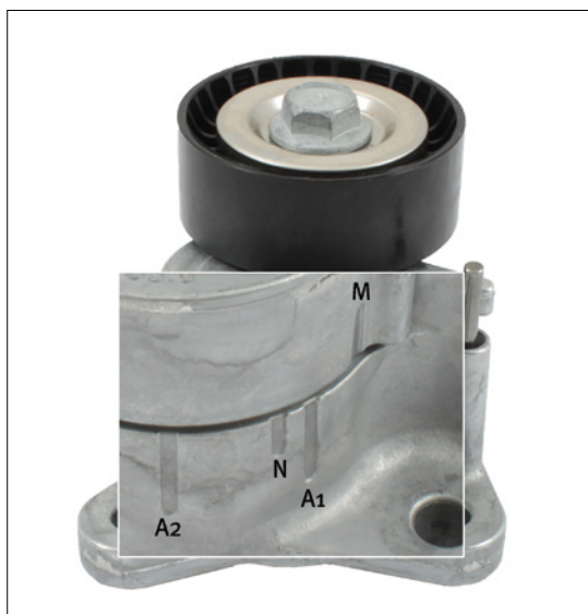
Fig. 2: Gewijzigde markeringen voor werkbereik van de spanarm

Als gevolg van de voortdurende verdere ontwikkeling van onze producten is de spanarm 534 0325 10 gemodificeerd.